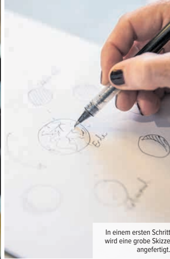
In einem ersten Schritt wird eine grobe Skizze angefertigt.