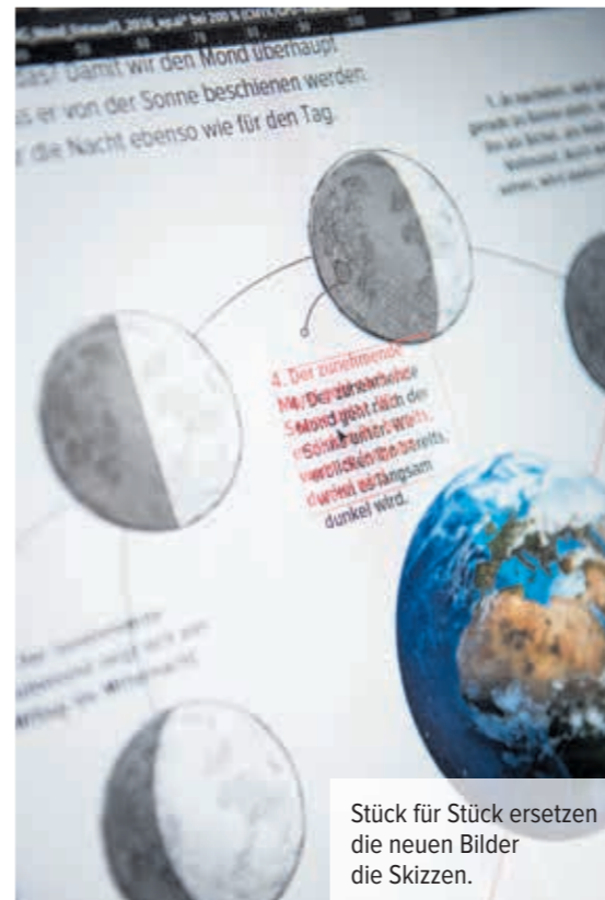
Stück für Stück ersetzen die neuen Bilder die Skizzen.