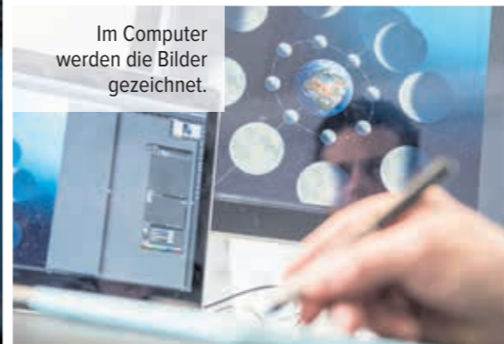
Im Computer werden die Bilder gezeichnet.